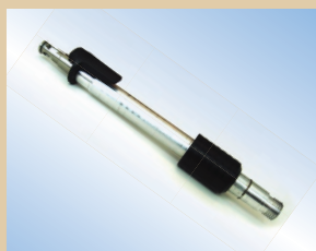
Наконечник, пневмокран Flex, алюминий, 150 мм с функцией защелкивания и стравливания воздуха, арт. № ..... 096228