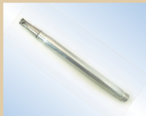
Наконечник, пневмокран Flex, алюминий, 150 мм, арт. № ..... 096008