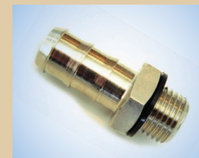
Соединение шланга 3/8" для пневмокрana Standard, арт. № ..... 096057