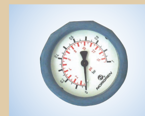
Манометр с защитным кожухом (Ø63 мм – шкала 0–1,0 бар), арт. № ..... 096041