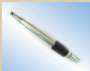
Наконечник, пневмокран Flex, алюминий, 150 мм с функцией стравливания воздуха арт. № ..... 096128