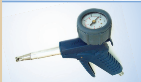
Пневмокран Bates Flex с манометром Ø40 мм, арт. №. 096049