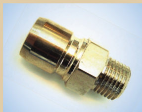
Соединения с наружной резьбой для пневмокрana Standard/Flex и пневмокрana Quick (устанавливается на пневмокран для быстрой смены между различными пневмокранами), арт. № ..... 096069