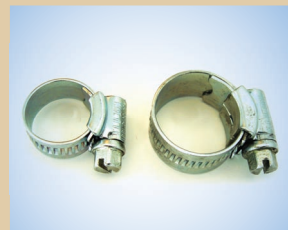
Зажим 1/2" арт. № ..... 096036 Зажим 3/8" арт. № ..... 096033