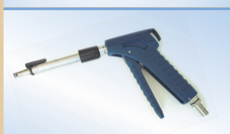
Пневмокран Bates Flex с функцией защелкивания и стравливания воздуха, арт. №. 096259