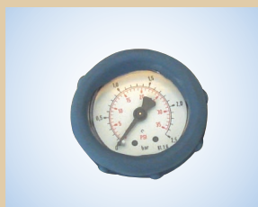
Манометр с защитным кожухом (Ø40 мм – шкала 0–2,5 бар), арт. № ..... 096053