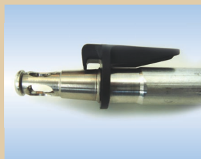
Наконечник, пневмокран Flex, алюминий, 80 мм с функцией защелкивания арт. № ..... 096240