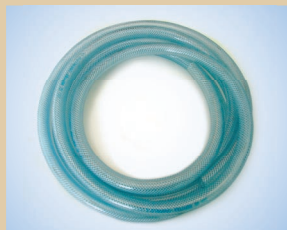
Шланг 1/2" (50 м) арт. № ..... 096035 Шланг 3/8" (50 м) арт. № ..... 096031