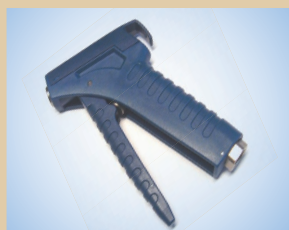
Ручка для пневмокрana, арт. № ..... 096060