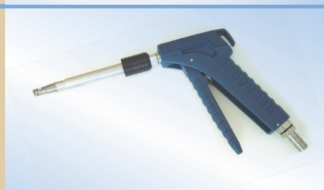
Пневмокран Bates Flex с трубой 150 мм и функцией стравливания воздуха, арт. №. 096059

Защелкивание. Пневмокран Bates Flex предлагается с функцией защелкивания. Преимуществом защелкивания является возможность зафиксировать пневмокран на воздушном пакете, что позволяет наполнять воздушный пакет используя всего лишь одну руку. После завершения наполнения пневмокран отсоединяется одним нажатием на «защелку».