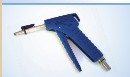
Пневмокран Bates Flex с функцией защелкивания, арт. №. 096248