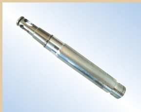
Наконечник, пневмокран Flex, алюминий, 80 мм, арт. № ..... 096040