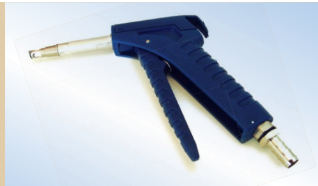
Пневмокран Bates Flex с трубой 80 мм, арт. №. 096048

Заправочный наконечник и другие принадлежности можно заказать отдельно (см. обратную страницу)